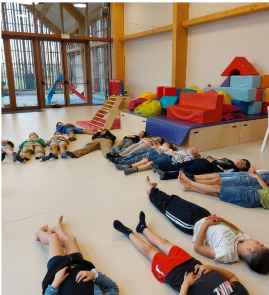
een les buikademhaling

De weerbaarheidstraining heeft als doel: